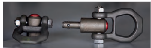
Die Anschlagpunkte lassen sich ohne Werkzeug am Oberteil oder am Unterteil befestigen.